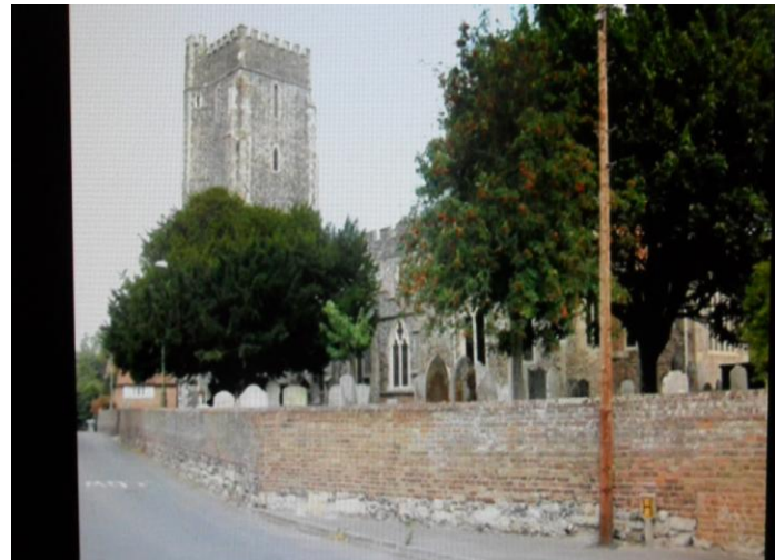
St Nicholas at Wade Parish