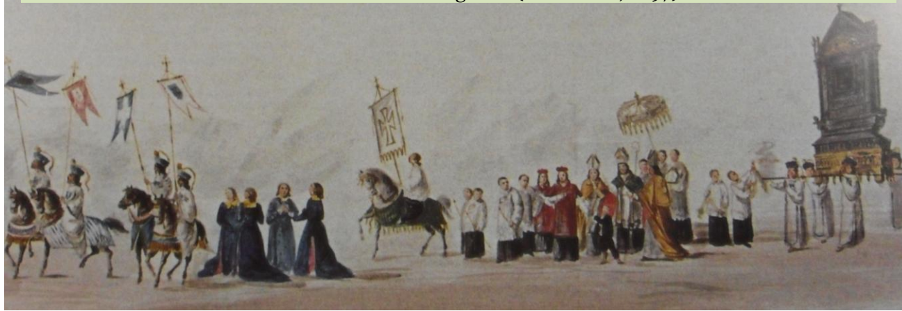
Giovinazzo. Processione della Madonna di Corsignano (E. Bernich, 1897). Pro Loco.

Allora alcuni che stavano arando nelle vicinanze, avendo udito le sue grida, accorsero e cominciarono a chiedergli che cosa avesse e da dove venisse. Scoperta dunque la causa e ciò che egli aveva commesso, subito si diressero a Giovinazzo, città che dista da Bari tre miglia ed era la città da cui provenivano. Andarono dal vescovo e gli riferirono ciò che avevano visto e udito. Allora il vescovo in fretta, accompagnato dal suo clero e da una grande moltitudine di gente con ceri e turiboli uscì dalla città e si diresse dove gli avevano detto che si trovava quell'uomo. Nel frattempo, anche i chierici baresi erano venuti a sapere l'accaduto. Atterriti oltre modo per il tesoro perduto, cominciarono a suonare le campane affinché il popolo accorresse alla chiesa. Comunicato l'accaduto, una grande agitazione si diffuse per la città. Tenuto consiglio, mandarono alcuni sul luogo ove avrebbe dovuto trovarsi il ladro. Altri invece si misero a pregare, chiedendo a Dio di non punirli per una simile negligenza, e che nella sua misericordia restituisse loro un tanto prezioso tesoro. Ascoltando le loro preghiere e lacrime e considerando i meriti del suo diletteissimo Nicola, nella sua misericordia Dio esaudì il loro desiderio.