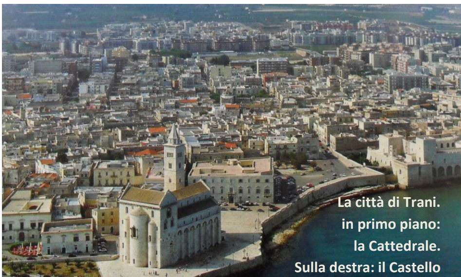
La città di Trani. in primo piano: la Cattedrale. Sulla destra: il Castello

Un giorno, mentre l'orefice stava lavorando nella sua bottega, venne a lui il segretario per vedere come procedeva il lavoro. Fra una parola e l'altra il tempo